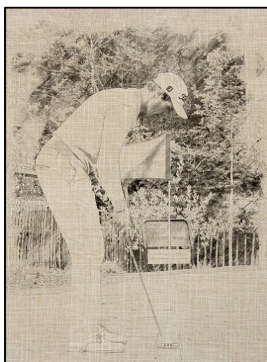
POSITION DES YEUX AU-DESSUS DE LA BALLE !!